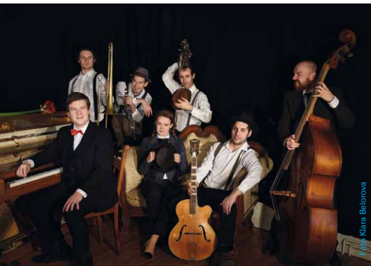
Das Timerag Departement aus Berlin